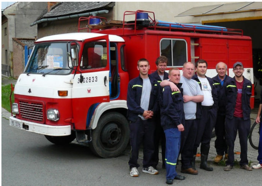
Obr. 4: r. 2009 – parta dobrovolníků před odjezdem do Polomi v rámci pomoci při bleskových povodních