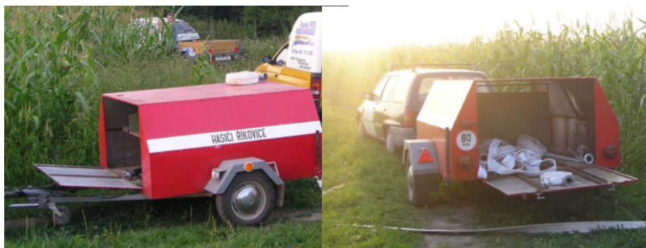
Obr. 1 a 2: r. 2005 – požár pole směrem na Tršaly.

Potřeba koňských sil byla patrna již při založení našeho sboru, tj. v roce 1897. Z dochovaných dokumentů dnes víme, že tehdejší říkovští „dobráci“ měli stříkačku taženou právě koňmi. Mrzí mne, že potřeba archivovat dění v našem sboru v letech následných uvadla anebo se prostě vlivem událostí a doby dokumenty nedochovaly. Tak či tak dnes nevíme, jaké prostředky byly našimi nedávnými předky využívány. V letech 70. a 80., kdy již některé okolní sbory vlastnily nějaké to příbližovadlo, naši hrdinové v modrých montérkách používali hlavně jednonápravový přívěs zvaný „buxa“. Éra mého mladého hasiče, léta 90., patřila ještě stále přívěsnému vozíku, avšak již v barvách červenobílých, jak se k hasičům patřilo. Vozík pojmul zejména čerpací agregát PS 8 nebo PS 12, savice délky 1,8 později 2,3 metru a další potřebné vybavení k hašení požáru, jako 8 hadic délky 20 metrů (4 x C a