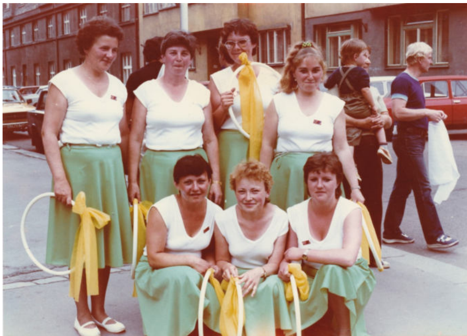
Členky TJ Sokol Říkovice na Spartakiádě v roce 1985.

ných pražských sletů. Problémy se cvičením nastaly, když špatný stav podlahy, znemožnil organizovat další nácviky v sále sokolovny v hostinci u Ludvů. Cvičenky se pak ke sportování musely scházet v bývalé základní škole. Definitivně se spolek vzdal práva na užívání sokolovny v roce 2000.