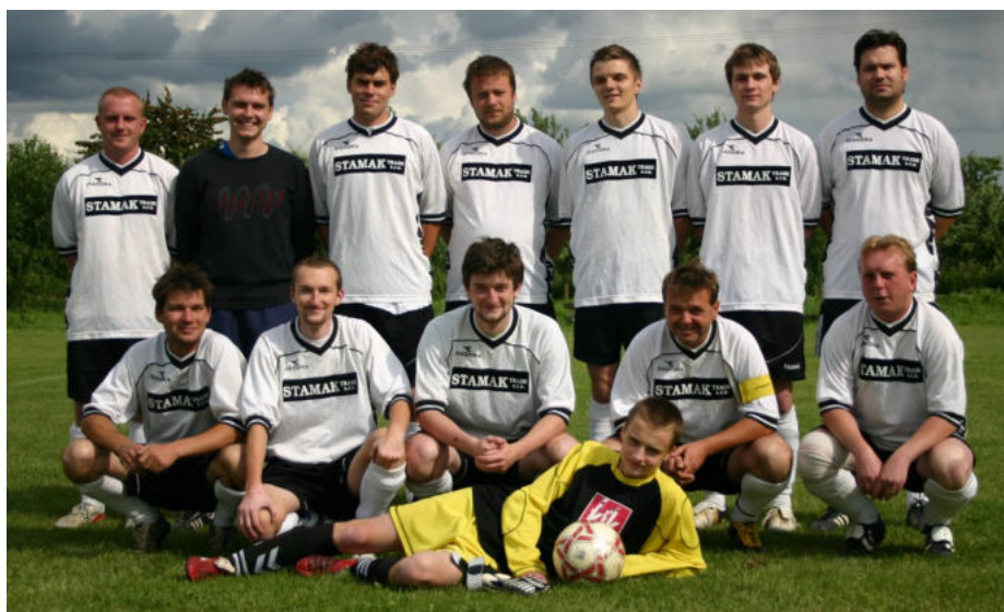
Fotbalisté TJ Sokola Říkovice v srpnu 1993 a červnu 2011.