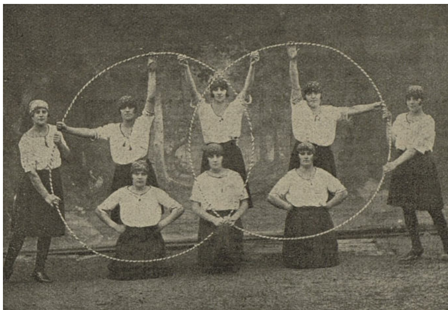
Členky Sokola Říkovice ve 20. letech. Věstník sokolský . Roč. 29, č. 17. 2. 1927.

si to jen v krátkosti připomeňme. Sokol je nejvýznamnější český a slovenský tělocvičný spolek. Založili jej v roce 1862 Miroslav Tyrš a Jindřich Fügner. Kromě zlepšování fyzické připravenosti svých členů se Sokol významně podílel i na české národní emancipaci, kvůli čemuž se několikrát dostal do střetu se státní mocí. Poprvé bylo jeho fungování omezeno rakousko-uherskými úřady během první světové války. Podruhé spolku zastavili činnost v roce 1941 nacisté a po převzetí moci v roce 1948 proti Sokolu vystoupili i komunisté. V Československu byl samostatný Sokol znovu-obnoven v roce 1990. Dnes má spolek zhruba 180 000 členů.