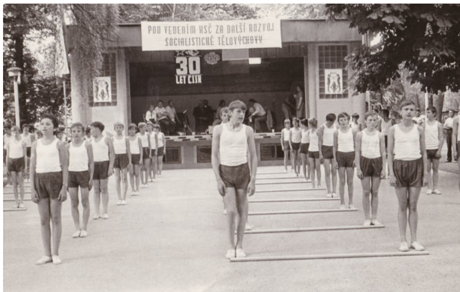
Veřejné cvičení v parku.

I v této době se v Říkovicích pod hlavičkou tělovýchovné jednoty cvičovalo, pořádala se veřejná cvičení a na hřišti se trénovala atletika. Na tradici všesokolských sletů navázaly od roku 1955 celostátní spartakiády, kterých se pak účastnili i vybírání členové místního Sokola. Vystupovat se jezdilo nejen do Prahy, ale v rámci družby oddílů i do Trutnova. Členové jednoty se aktivně podíleli i na kulturním životě v obci, kdy se organizovali výlety, zábavy, brigády a další veřejné akce.