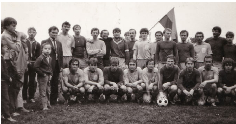
Fotbalisté po domácím přátelském zápase (2:6) s hokejisty Gottwaldova. 18. 5. 1985