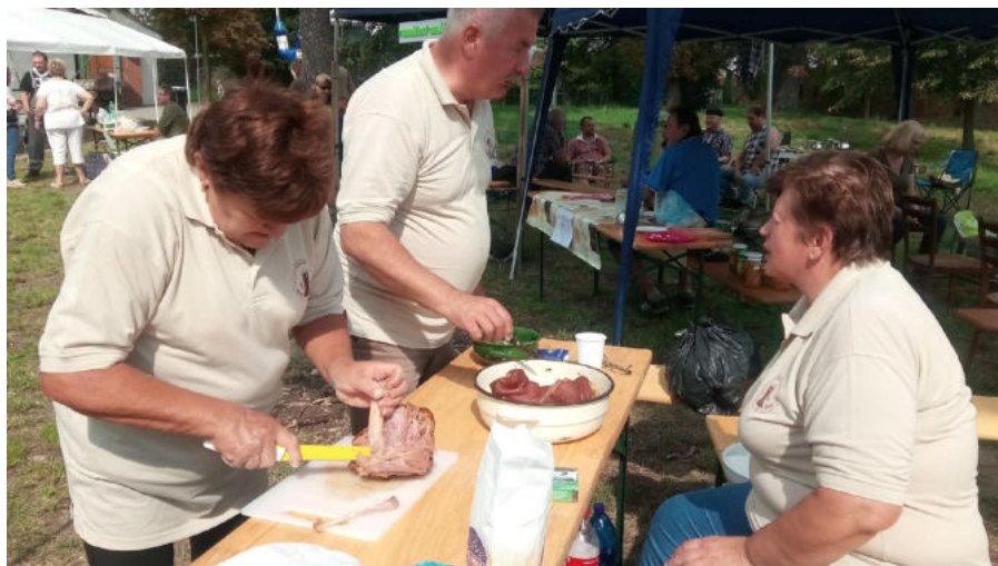
Maďarská delegace při vaření pravého maďarského guláše v Říkovicích

Závěr roku patřil oslavám pro naši republiku největšího kalibru. Za doprovodu lampionových světylek, položení věnce u tatíčka a hymny české a slo-